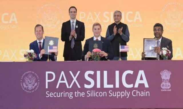
గ్రూపును గత ఏడాది డిసెంబర్ లో అమెరికా లాంచ్ చేసింది. దీంతో కొన్ని కీలకమైన టెక్నాలజీ భాగస్వామ్యంలు ఉన్నాయి. ప్యాక్స్ సిలికా బృందంలో జపాన్, దక్షిణ కొరియా, సింగపూర్, నెదర్లాండ్స్, యూకే, ఇజ్రాయిల్, యూఎకె, ఆస్ట్రేలియా దేశాలు ఉన్నాయి. ప్రపంచవ్యాప్తంగా సురక్షితమైన, ఇన్ స్టేబిల్ సిలికాన్, కృత్రిమ మేధ వ్యవస్థను రూపొందించే ఉద్దేశంతో ప్యాక్స్ సిలికా మొదలుపెట్టారు.