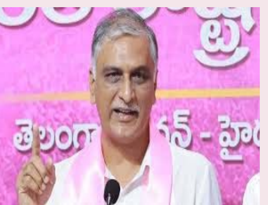
ఏటా రూ. 20,000 కోట్ల బడ్జెట్ కేటాయిస్తామని చెప్పి, అధికారంలోకి వచ్చాక బీసీలకు కాంగ్రెస్ పార్టీ మొండిచేయి చూపింది. వరంగల్ సభలో రైతు డిక్షరేషన్ అని చెప్పి రాహుల్ గాంధీ - మగతా3లో

పేరిట దళితులకు 18% రిజర్వేషన్లు, ఎన్నో సబ్ ప్లాన్ అమలు చేస్తామని మోసం చేశారు. చదువుకునే బిల్లలకు టెన్స్ పాస్ అయితే రూ. 10,000, ఇంటర్ పాస్ అయితే రూ. 25,000, డిగ్రీకి రూ. 50,000, పీజీ చదివితే లక్ష రూపాయలు ఇస్తామని చెప్పి.. ఈరోజు వరకు ఒక్క విద్యార్థికి కూడా ఒక్క రూపాయి ఇచ్చిన పాపాన పోలేదు. కనీసం కేసీఆర్ గారు ఇచ్చిన ఫీజు రీయింబర్స్మెంట్ దబ్బులు కూడా రావడం లేదని అన్నారు. కామారెడ్డి బీసీ డిక్షరేషన్ సభకు నిర్దేశించిన సీటుకొచ్చి, బీసీ సబ్ ప్లాన్ అమలు చేస్తామని చెప్పారు. బీసీలకు 42% రిజర్వేషన్లు కల్పిస్తామని,