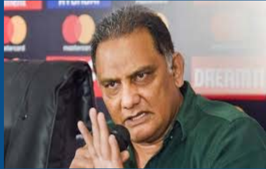
అజారుద్దీన్ - మగతా3లో

హైదరాబాద్, ఫిబ్రవరి 20: అసూహ్యంగా మంత్రి అయిన అజారుద్దీన్ పదవీ గండం వెంటాడుతోంది. గతేడాది జూలైలో అతని పదవీ గండం వెంటాడుతోంది. గతేడాది జూలైలో అతని పదవీ గండం వెంటాడుతోంది. గతేడాది జూలైలో అతని పదవీ గండం వెంటాడుతోంది.