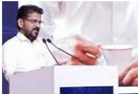
ప్రస్తావించారు. ఏఐ - మగతా3లో

హైదరాబాద్, ఫిబ్రవరి 20 : ప్రస్తుతం యావత్ సమగ్రంగా నిర్వహించేందుకు ప్రత్యేక వ్యవస్థ అవసరమని సీఎం స్పష్టం చేశారు. ఏఐ సమిట్ లో పాల్గొన్న సీఎం.. ఢిల్లీలో నిర్వహించిన ఏఐ సమిట్ లో సీఎం రేవంత్ రెడ్డి ఇవాళ (శుక్రవారం) పాల్గొని ప్రసంగించారు. మానవ చరిత్రలో అగ్ర, చక్రం, వ్యవసాయం, విద్యుత్, ఇంటర్నెట్ వంటి అవిష్కరణలు ప్రపంచాన్ని ఎలా మార్చాయో ప్రస్తావించారు. ఏఐ - మగతా3లో