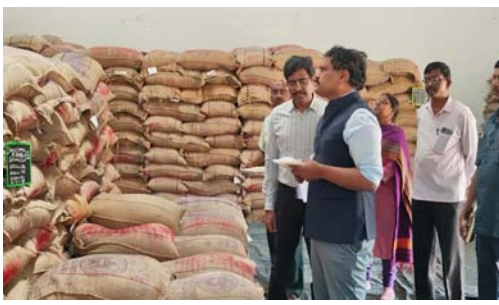
దశలోనే క్షుణ్ణంగా తనిఖీలు నిర్వహించాలని, ప్రభుత్వ నిబంధనలకు విరుద్ధంగా ఉన్న నిల్వలను తీరస్థులచే నిర్మూలన గోదాం ఇన్‌చార్జీలకు సూచించారు. ఈ విషయంలో ఏం మాత్రం రాచి పడిన కఠినంగా వ్యవహరిస్తానని హెచ్చరించారు. ప్రజలకు చేరే ప్రతి బియ్యం గింజ నాణ్యమైనదిగా ఉండేలా బాధ్యతగా

హైదరాబాద్ ఫిబ్రవరి 21: పేద ప్రజలు కూడా సంపన్నులతో సమానంగా సన్నబియ్యంతో భోజనం చేయాలన్న మహత్తర సంకల్పంతో తెలంగాణ ప్రభుత్వం రేషన్ దుకాణాల ద్వారా సన్నబియ్యం సరఫరా చేస్తున్నట్లు పౌరసరఫరాల శాఖ ప్రధాన కార్యదర్శి మరియు ఎక్స్-ఆఫీషియో కమిషనర్ ఎం. స్పీఫెన్ రవీంద్ర, తెలిపారు. బియ్యం నాణ్యత విషయంలో ఏమాత్రం రాజీ పడకూడదని ఆయన అధికారులను కఠినంగా ఆదేశించారు. హైదరాబాద్ లోని బాగ్ లింగంపల్లిలో ఉన్న సివిల్ సప్లై గోదామను కమిషనర్ ఆకస్మికంగా తనిఖీ చేశారు. దాదాపు రెండు గంటలపాటు గోదామలో నిల్వ ఉన్న బియ్యం సంపూర్ణ యాధునికంగా తెరిచింది నాణ్యతను స్వయంగా పరీక్షించారు. బియ్యం లో నూకల శాతం, తేమ శాతం వంటి అంశాలపై అధికారులను ప్రశ్నించి పూర్తి వివరాలు తెలుసుకున్నారు. గోదామకు వచ్చిన బియ్యాన్ని స్వీకరించే