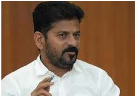
భాగ్యతలు కానీ లేవని ప్రభుత్వం అభిప్రాయపడుతోంది. కేవలం పదవులు ఉండి, నిధులు, విధులు లేకపోవడం వల్ల

హైదరాబాద్, ఫిబ్రవరి 21: తెలంగాణ రాష్ట్రంలోని స్థానిక సంస్థల పరిపాలనా వ్యవస్థను సమూలంగా ప్రక్షాళన చేసే దిశగా రేవంట్ రెడ్డి ప్రభుత్వం అత్యంత కీలకమైన అడుగులు వేస్తోంది. రాష్ట్రంలోని ఎంపీటీసీ, జడ్పీటీసీ వ్యవస్థలను పూర్తిగా రద్దు చేయాలనే ఆలోచనలో ప్రభుత్వం ఉన్నట్లు తెలుస్తోంది. ఒక వేళ ఈ ప్రతిపాదన కార్యరూపం దాల్చితే, తెలంగాణ రాజకీయాల్లో ఇది ఒక పెను సంచలనంగా మారొచ్చు. తెలంగాణలో ప్రస్తుతం అమల్లో ఉన్న మూడవలె పంచాయతీరాజ్ వ్యవస్థలో ఎంపీటీసీ, జడ్పీటీసీల పాత్రపై ప్రభుత్వం సుదీర్ఘంగా సమీక్ష నిర్వహించింది. ఈ వ్యవస్థ రద్దు చేయాలనే ఆలోచన వెనుక మూడు బలమైన కారణాలు కనిపిస్తున్నాయి. ఈ వ్యవస్థ ద్వారా ప్రజల చేత ఎన్నికైన ప్రతినిధులకు క్షేత్రస్థాయిలో సరైన అధికారాలు కానీ, నిర్ణయమైన