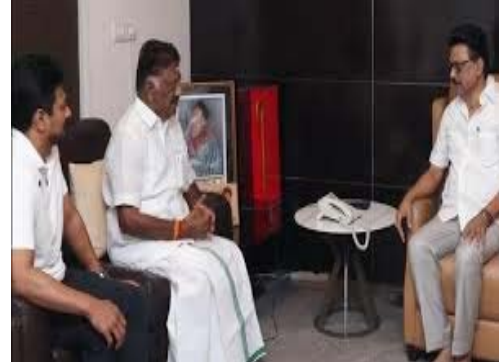
తెలపడం అందరినీ ఆశ్చర్యపరిచింది. శాసనసభ సమావేశాల ముగింపు సందర్భంగా ముఖ్యమంత్రి స్టాలిన్ ను కలిసిన ఓపీఎస్, అసంతరం మీడియాతో మాట్లాడారు. డీఎంకే బడేళ్ల పాలన అత్యంత అద్భుతంగా ఉందని కొనియాడారు. అందుకే ఉదయాన్నే ముఖ్యమంత్రిని కలిసి అభినందనలు తెలిపానని చెప్పారు. రాష్ట్రంలో ప్రస్తుతం ఉన్న పరిస్థితులను బట్టి చూస్తే మళ్లీ డీఎంకే అధికారంలోకి వచ్చే అవకాశాలు పుష్కలంగా ఉన్నాయని ఆయన విశ్లేషించారు.