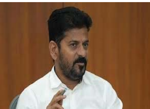
ఉంటాయి. కానీ ఎంపీటీసీలకు, జెడ్పీటీసీలకు ప్రత్యేకంగా నిధులు గానీ, కార్యాలయాల్లో కనీసం కూర్చునేందుకు సీటు గానీ ఉండటం లేదనే అసంతృప్తి ఉంది. ఒకే గ్రామంలో సర్పంచ్, ఎంపీటీసీ మధ్య తరచూ ఘర్షణ వాతావరణం నెలకొంటోంది. అధికారాల విభజనలో స్పష్టత లేకపోవడం అభివృద్ధికి అటంకంగా మారుతోందని నిపుణులు అభిప్రాయపడుతున్నారు. ప్రస్తుతం ఎమ్మెల్యే ఎన్నికల్లో ఎంపీటీసీ, జెడ్పీటీసీలకు ఓటు హక్కు ఉంది, కానీ సర్పంచులకు లేదు. వ్యవస్థను రద్దు చేయడం ద్వారా ఈ అసమానతలను తొలగించవచ్చని ప్రభుత్వం భావిస్తోంది. అయితే.. ఈ నిర్ణయం అమలు చేయడం అంత

- మొదటి పేజీ తరువాయి రేవంత్ ప్రభుత్వం పంచాయతీ రాజ్ శాఖను ఆదేశించింది. ఈ నివేదికలో ఈ వ్యవస్థల వల్ల జరుగుతున్న లాభనష్టాలు, రద్దు చేస్తే కలిగి పరిణామాలు, ఇతర రాష్ట్రాల్లోని పరిస్థితులను పొందుపరచనున్నారు. ప్రభుత్వం ఈ దిశగా చర్యలు వేగంగా తీసుకుంటున్నా చట్టపరంగా, రాజ్యాంగపరంగా ఈ నిర్ణయం అమలు చేయడం అంత సులభం కాదని తెలుస్తోంది. దేశంలో పంచాయతీరాజ్ వ్యవస్థ అనేది 73వ రాజ్యాంగ సవరణ ద్వారా దేశవ్యాప్తంగా ఒకే తీరుగా అమలులోకి వచ్చింది. రాజ్యాంగంలోని నిబంధనల ప్రకారం, రాష్ట్రాలు తమ ఇష్టానుసారం మూడు అంచెల వ్యవస్థలో మార్పులు చేయడం సాధ్యం కాదు. ఎంపీటీసీ, జడ్పీటీసీలను రద్దు చేయాలంటే కేంద్ర ప్రభుత్వం ద్వారా రాజ్యాంగ సవరణ తప్పనిసరి అని నిపుణులు చెబుతున్నారు. రాష్ట్ర ప్రభుత్వం ఇచ్చే నివేదిక ఆధారంగా, ఈ ప్రతిపాదన చట్టపరంగా, రాజకీయంగా ఎంత వరకు సాధ్యమవుతుందనే దానిపై ప్రభుత్వం తుది నిర్ణయం తీసుకోనుంది. కేవలం రాష్ట్ర స్థాయిలో ఒక తీర్మానం చేయడం ద్వారా లేదా ఆర్డినెన్స్ తీసుకురావడం ద్వారా ఈ వ్యవస్థను రద్దు చేయడం కుదరదని ఒక వేళ కేంద్రం సహకరించకపోతే ఇది న్యాయపరమైన చిక్కులకు దారితీస్తుందని విశ్లేషకులు హెచ్చరిస్తున్నారు. ఈ వ్యవస్థలో సర్పంచులకు గ్రామంలో నిధులు, విధులు