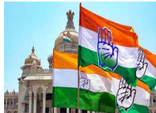
డీఎంకేపైనే ఆధారపడాల్సిన పరిస్థితి ఉంది. సీట్ల సర్దుబాటు విషయంలో డీఎంకే ఈసారి కఠినంగా వ్యవహరించే అవకాశం ఉండటంతో కాంగ్రెస్ కు ఇది సవాలుగా మారింది. త్రిముఖ పోరులో డీఎంకేకు లాభం కలుగుతుందన్న అంచనాలు వస్తున్నాయి. సాధారణంగా కేరళలో బడేళ్లకోసారి ప్రభుత్వం మారుతుంది, కానీ గత ఎన్నికల్లో పినరాయ విజయన్ ఆ సంప్రదాయాన్ని బ్రేక్ చేశారు. ఇప్పుడు వరుసగా మూడోసారి అధికారం దక్కించుకోవాలని ఎల్ డిఎఫ్ చూస్తోంది. కాంగ్రెస్ నేతృత్వంలోని యుడిఎఫ్ కి ఇది చావో రేవో లాంటి ఎన్నిక. ఒకవేళ ఇక్కడ కూడా కాంగ్రెస్ ఓడిపోతే, జాతీయ స్థాయిలో ఆ పార్టీ నైతిక స్థైర్యం పూర్తిగా దెబ్బతింటుంది. అటు బీజేపీ కూడా క్రైస్తవ ఓటర్లను ఆకట్టుకుంటూ ఇక్కడ బలపడాలని చూస్తోంది. ప్రియాంకా గాంధీ వాయునాద్ నుంచి ఎంపీగా ఉండటంతో గెలుపు

పశ్చిమ బెంగాల్, కేరళ, తమిళనాడు, అసోం, పుదుచ్చేరి అసెంబ్లీ ఎన్నికలు వచ్చే ఘడిదు నెలల్లో జరగనున్నాయి. చాలా కాలంగా కాంగ్రెస్ పార్టీ గెలుపొందే అనుకున్న రాష్ట్రాల్లో కూడా ఓడిపోతోంది. రాను రాను ఆ పార్టీ పరిస్థితి దిగజారుతోంది. ఇలాంటి సమయంలో మరో ఐదు రాష్ట్రాల ఎన్నికలు వచ్చాయి. ఈ ఐదు రాష్ట్రాల్లో ముఖాముఖి, కూటములుగా తలపడే పరిస్థితులు ఉన్నాయి. జాతీయ స్థాయిలో కాంగ్రెస్ పార్టీ వరుస ఓటములతో నతమతమవుతున్న వేళ, ఈ ఎన్నికలు ఆ పార్టీ ఉనికికి ప్రతిపక్ష కూట బిక్కుతకు అగ్నిపరీక్షగా మారాయి. పశ్చిమ బెంగాల్ లో మరోసారి తృణమూల కాంగ్రెస్, బీజేపీ మధ్య ముఖాముఖి పోరు నెలకొంది. ముఖ్యమంత్రి మమతా బెనర్జీ నేతృత్వంలోని డీఎంకే తన సంక్షేమ పథకాలు , బెంగాలి ఆస్తికంపై సమృద్ధి పెట్టుకోగా, ప్రభుత్వ వ్యతిరేకత, అవినీతి ఆరోపణలను బీజేపీ తన ప్రధాన అస్త్రాలుగా మార్చుకుంది. ఇక్కడ కాంగ్రెస్, వామపక్షాలతో కలిసి పోటీ చేస్తున్నప్పటికీ, ప్రధాన పోటీ మాత్రం డీఎంకే-బీజేపీ మధ్య ఉండేలా కనిపిస్తోంది. ముస్లిం ఓట్ల సమీకరణ ఇక్కడ గెలుపొటమలను శాసించనుంది. మమతా బెనర్జీ ఎంతో సమృద్ధిగా ఉన్నప్పటికీ.. బీజేపీ కూడా గెలిచి చూపిస్తామన్న ధీమాతో ఉంది. తమిళనాడులో అధికార డీఎంకే కూటమి బలంగా ఉన్నప్పటికీ, నలుగురు విజయ స్థాపించిన తమిళగ వెల్రీ కళగం రాకతో రాజకీయ సమీకరణాలు మారుతున్నాయి. అన్నా డీఎంకే తన కోల్పోయిన వైభవాన్ని చాటుకోవాలని చూస్తూంటే, బీజేపీ తన ఓటు బ్యాంకును పెంచుకోవడానికి తీవ్రంగా శ్రమిస్తోంది. కాంగ్రెస్ ఇక్కడ