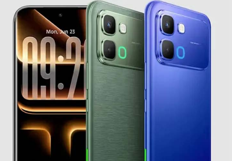
యాఎస్బీఐ టైమ్--సీ పోర్ట్, ఐఆర్ సెన్సార్ ఉన్నాయి. ఇన్-- డిస్ప్లే ఫింగర్ ప్రింట్ సెన్సార్లున్నాయి.

రెసిస్టెన్స్ సర్టిఫికేట్, ఆండ్రాయిడ్ 16 ఆధారిత ఎక్స్.ఎస్ 16 ఆపరేటింగ్ సిస్టం తదితర ఫీచర్లు ఉన్నాయి. వెనకవైపు 50 మెగా పిక్సెల్ మెయిన్ కెమెరాతో పాటు 8 మెగా పిక్సెల్ అల్ట్రా వైడ్ లెన్స్తో కూడిన డ్యూయల్ కెమెరా సెట్ ఆప్ ఉంది. ముందువైపు సెల్ఫీలు, వీడియో కాల్స్ కోసం 13 మెగా పిక్సెల్ సెల్ఫీ కెమెరా ఇచ్చారు. 6500 ఎంపిహెచ్ బ్యాటరీ ఉంది. 45డబ్ల్యూ ఫాస్ట్ ఛార్జింగ్ సదుపాయంతో వస్తోంది. 5జీ, డ్యూయల్ 4జీ వీఓఎల్ఈటీ కనెక్టివిటీ సపోర్టులున్నాయి. వై-ఫై, బ్లూటూత్ 5.4, జీపీఎస్, ఎస్ఎఫ్ఎస్ ఉన్నాయి.