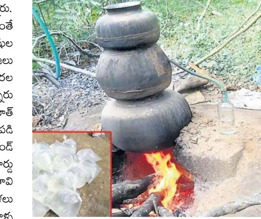
విక్రయదారులపై కఠిన చర్యలు తీసుకోవాలని గ్రామ మహిళలు కోరుతున్నారు.

మార్గం మధ్యలో సంప్రదింపులు చేసుకొని వదిలేస్తున్నారు. లేదంటే తానిల్వార్ ముందు బైండ్ ఓవర్ చేసేస్తారు. అంతే ఇద్దరి అధికారుల కనుసైగలో గ్రామ లోని పెద్ద మనుషుల సమక్షంలో పూచికత్ మీద వదిలేస్తున్నారు అని ప్రజలు మహిళలు తెలుపుతున్నారు. వారము లేఖ రెండు వారల తర్వాత మల్ల తిరిగి వచ్చి యధావిధిగా సారా అమ్ముతున్నారు అని మహిళలు తెలుపుతున్నారు. సారాను అధికంగా యూత్ వార్ తాగి కాళ్ళు చేతులు ఆడని దుస్థితిలో ఇందిలో పడి ఉన్నారు అని మహిళలు అంటున్నారు. మా వారు బస్టాండ్ కూడలికి వెళ్ళగా డబ్బులు లేవంటే నీ వృద్ధుల పెన్షన్ కార్డు ఇస్తే పెన్షన్ వచ్చిన తర్వాత నేను డబ్బులు పట్టుకొని మిగతావి మీకు ఇస్తామని సారా పోస్తున్నట్లు గ్రామ మహిళలు తెలుపుతున్నారు. సారా ఒప్పుడం చేసుకొని కార్డు వాళ్ళ దగ్గరనే పెట్టుకుంటున్నారు అని మహిళలు తెలుపుతున్నారు. సంబంధిత అధికారులు సారా బట్టిలపై, సారా