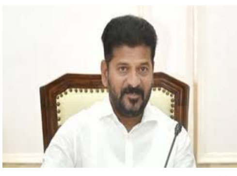
ఇక్కర్, మహిళా సాధికారత వంటి పథకాలు అర్హులకు చేరాలి

- మొదటి పేజీ తరువాయి స్పష్టమైన మార్పు తేవాలన్నది మా సంకల్పం. ఆ ఉద్దేశంతోనే "ప్రజా పాలన -- ప్రగతి ప్రణాళిక" పేరుతో కార్యక్రమాన్ని ప్రారంభించాం. మార్చి 6 నుండి 99 రోజుల పాటు, గ్రామ స్థాయి నుండి రాష్ట్ర స్థాయి వరకు, అన్ని శాఖల సమన్వయంతో ఈ కార్యక్రమం ఒక ఉద్యమంలా సాగుతోంది. ఊరు వార సమస్యల పరిష్కారమే పరమావధిగా ప్రతి అధికారి పని చేయాలి. వేగంగా పైళ్ల క్రియారెస్ట్, ప్రభుత్వ కార్యాలయాల్లో పరిశుభ్రత, నిర్ణయాల్లో పారదర్శకత ఉండాలి. మహాత్మా - ఉచిత బస్సు సౌకర్యం, ? 500 కే గ్యాస్ సిలిండర్, 200 యూనిట్ల వరకు ఉచిత విద్యుత్, ఆరోగ్యశ్రీ, రేషన్ కార్డులు, సన్నబియ్యం, ఇందిరమ్మ